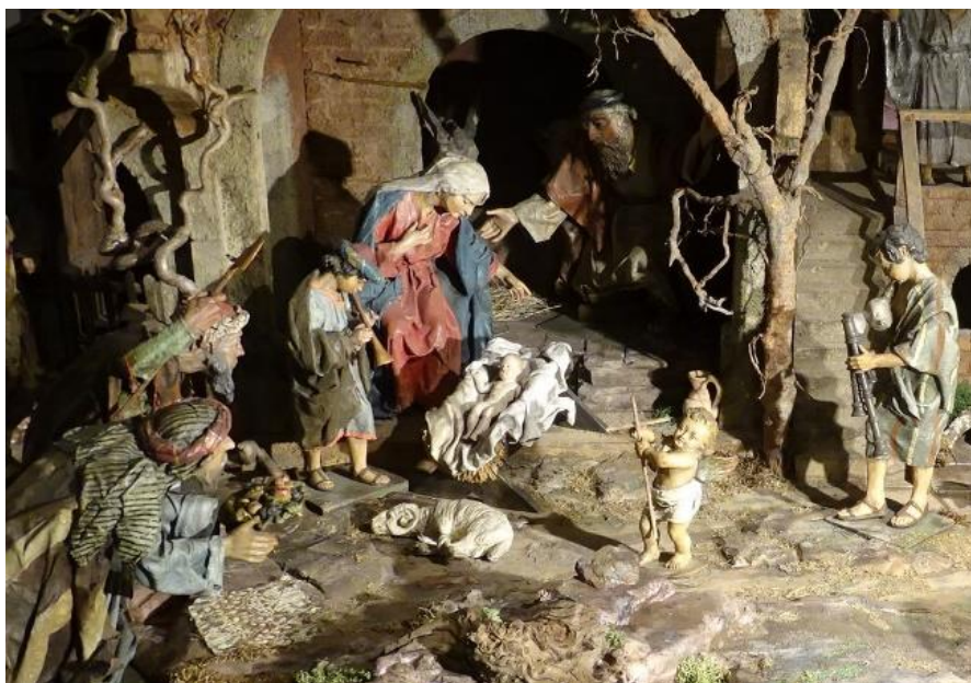
(Krippe aus der diözesanen Sammlung)

Persönlich und im Namen der Schulstiftung sage ich ein herzliches Vergelt's Gott für die gute und vertrauensvolle Zusammenarbeit und wünsche ein licht- und gnadenreiches Weihnachtsfest sowie ein gutes, gesundes und friedvolles neues Jahr 2025 mit Gottes reichstem Segen!